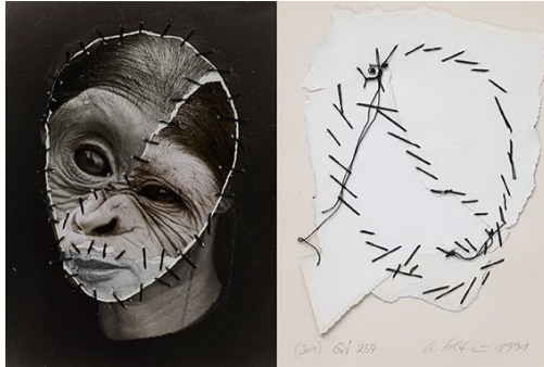
KfK-1.jpg Annegret Soltau - GRIMA - Selbst mit Affe

Nicole Rüffer Organisationsteam LIONS-Benefizveranstaltungen Bilder Die Bilder erhalten Sie gerne auf Anfrage.