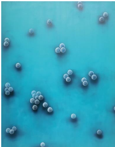
KfK-2.jpg Axel Thieme - Succession